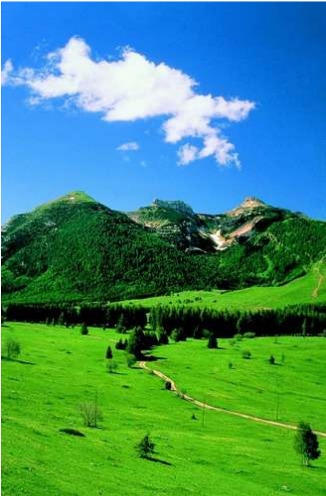
Le Tre Cime: Cima Verde, Doss d'Abramo, Cornetto