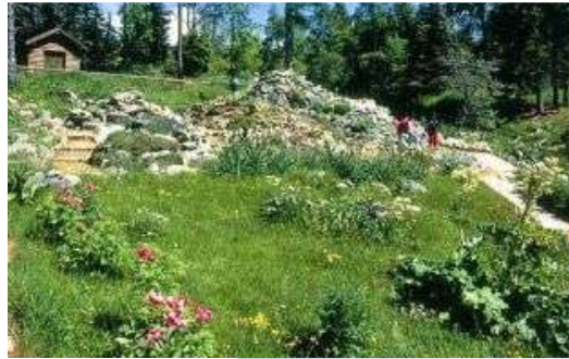
Giardino Botanico Alpino

Nei pressi del Rifugio Viotte ci si potrà fermare a visitare il Giardino Botanico Alpino, uno dei più importanti delle Alpi con oltre duemila specie di piante e fiori oppure risalire la Val dei Cavai per raggiungere i piedi del Cornetto; la salita sarà faticosa e impegnativa ma si potrà godere dello stupendo panorama sulla sottostante Valle dei Laghi e verso le Dolomiti di Brenta.