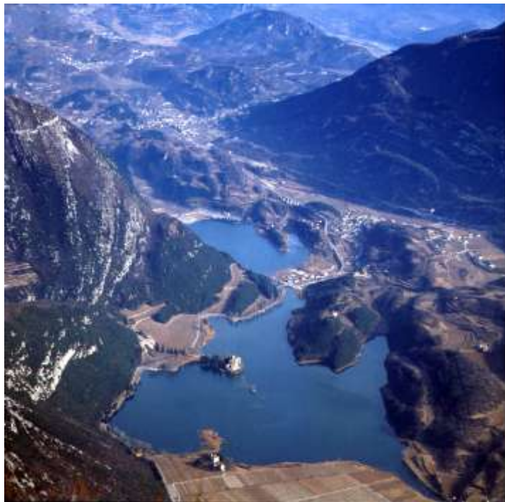
Laghi di Santa Massenza e Toblino

Nel pomeriggio si lascerà Lagolo per scendere lungo una vecchia stradina ciottolata che porta sopra al paese di Calavino, si proseguirà verso Vezzano sempre seguendo sentieri nel bosco, da dove si potranno ammirare i sottostanti laghi di Toblino e Santa Massenza. Il nostro anello si chiuderà a Vezzano.