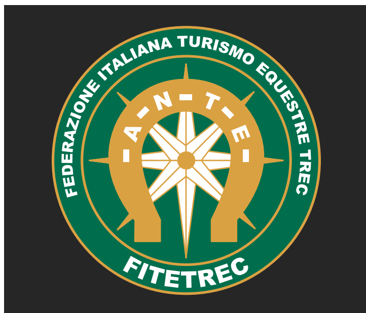
Logomarchio Positivo Colore

Versione da preferire ovunque ne sia possibile l'utilizzo. Vive preferibilmente su fondo bianco, ma è utilizzabile anche su fondi scuri o colorati.