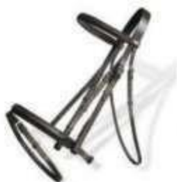
Con chiudi bocca